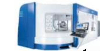
POWERSKIVING Bearbeitungszentren und CNC-Drehmaschinen zu Herstellung von Verzahnungen