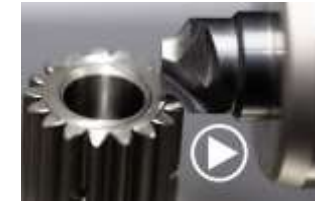
Entgraten, Anfasen, Abdachen

Auf Wunsch unterstützen wir Sie auch beim Verkauf Ihrer Maschinen und Anlagen und bieten Ihnen hier, in Zusammenarbeit mit einem qualifizierten Team aus erfahrenen Sachverständigen und Gutachter, folgende Leistungen an: