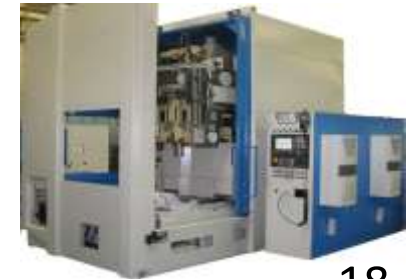
ZAHNRADSTOSSMASCHINEN Liebherr, Lorenz, Gleason Pfauter, TOS, FELLOWS