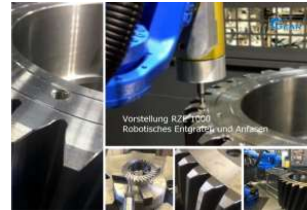
*Zahnrad Entgraten, Abdachen, Anfasen