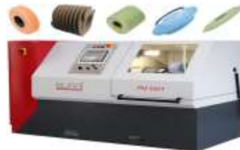
PROFILIERMASCHINEN BURRI PM 550 T zum Vor- und Fertigprofilieren von Schleifscheiben, Schleifschnecken und Honringen...