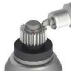
Geardeburring Universelle Zahnrad Entgratmaschinen zum wirtschaftlichen Entgraten von Zahnrädern, Hohlräder und Rotoren ab Modulbereich 0,5