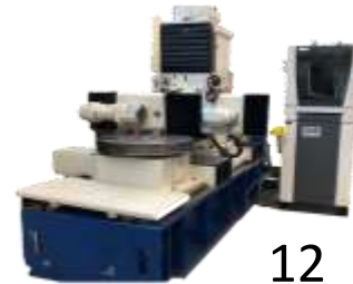
MASCHINENSUCHER Search – Find - Sell – Buy Verzahnungsmaschinen