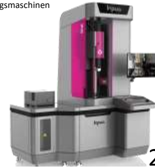
ZAHNRADMESSMASCHINE INPROQ ZM 300 Lasertec Optische Messtechnik für die Zahnradwelt