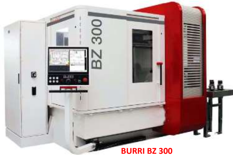
BURRI BZ 300 12 Universelle Zahnradradschleifmaschine ....Wälz-, Profil- und Schneckenschleifen