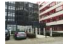
Hamburg NL Nord (In Planung)